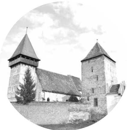
Biserica fortificată din Brăteiu