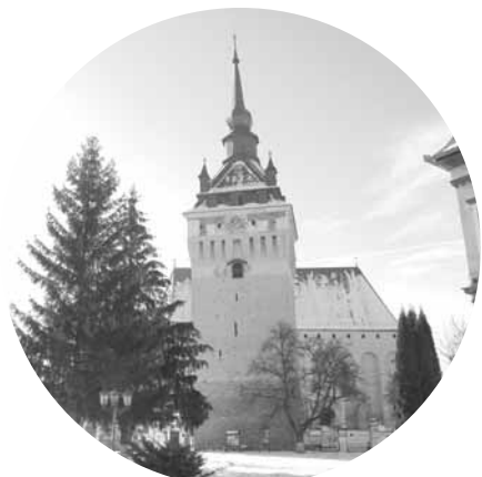
Biserica fortificată din Saschiz

„Cardul Transilvania” se poate cumpăra atât din librării, biserici săsești din Sibiu, Mediaș, Sighișoara, Râșnov, Biertan, Miercurea Ciuc, Brașov, Timișoara și Cluj-Napoca, dar și on-line, de pe site-ul www.transylvania-card.ro . Acest card se vinde cu o hartă a bisericilor fortificate la prețul de 60 de lei. Harta este disponibilă în variantele germană/română și engleză/română. De asemenea, există un calendar cultural pentru zona bisericilor fortificate, care centralizează evenimentele deschise publicului larg.