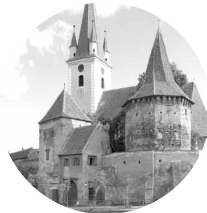
Biserica fortificată din Cristian

Aplicația a fost dezvoltată împreună cu Eventya, unul dintre cei mai importanți dezvoltatori de aplicații mobile din România. ( www.kirchenburgen.org )