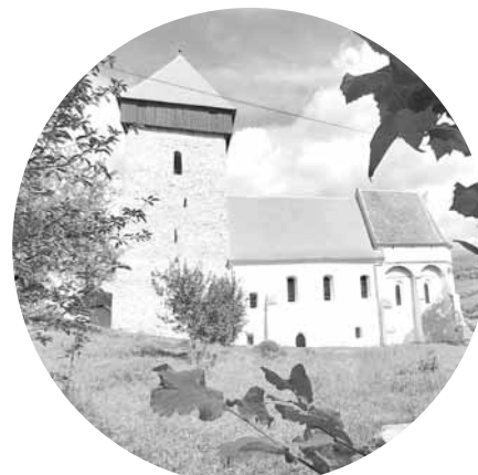
Biserica fortificată din Ruja